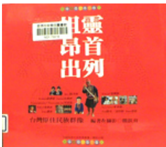
祖靈昂首出列/臺灣原住民族群像