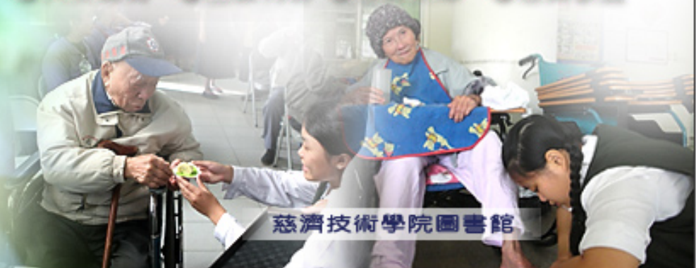
慈濟技術學院圖書館