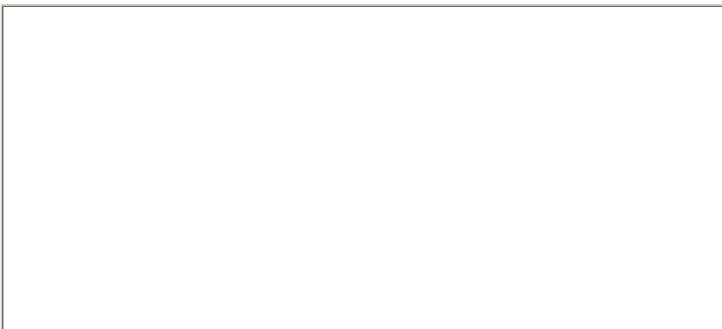
圖3：圖書館視聽資料區環境