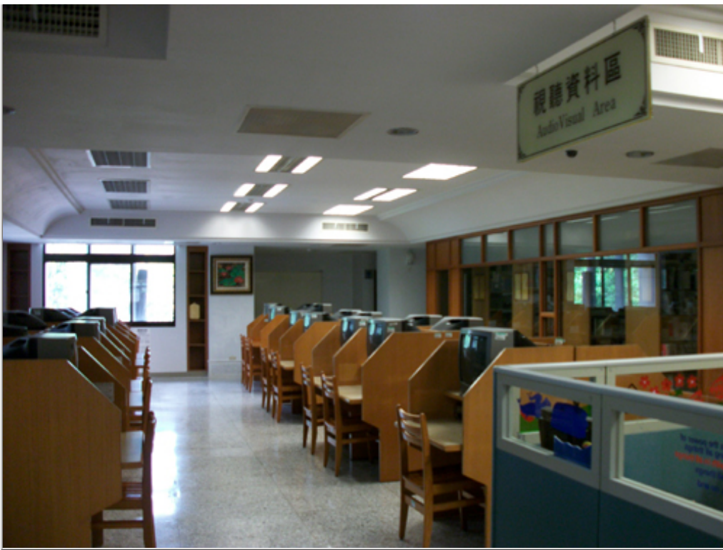
圖4：新進視聽資料展示區