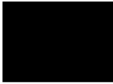
■ 法譬如水經藏演繹集訓驗收 果報障-至誠發願