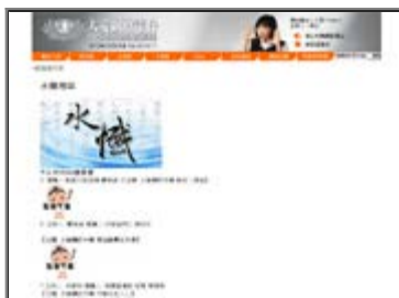
■ 大愛網路電台 - 水懺專區