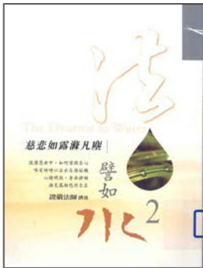
澈見萬物悠然自在