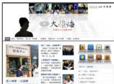
■ 慈濟基金會- 大懺悔 法譬如水·經藏演繹