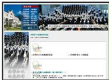
■ 慈濟技術學院 - 法譬如水經藏演繹專區