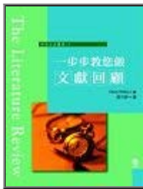
一步步教您做文獻回顧