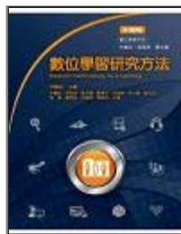
數位學習研究方法