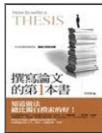
撰寫論文的第一本書