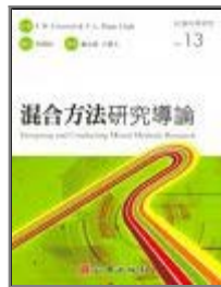
混合方法研究導論