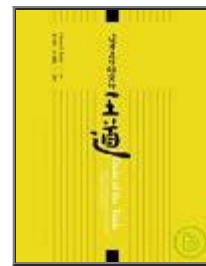
這才是做研究的王道