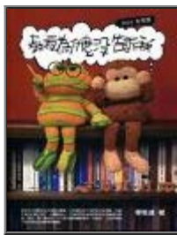
教授為什麼沒告訴我