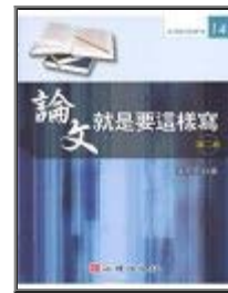
論文就是要這樣寫