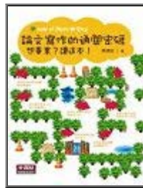
論文寫作的通關密碼