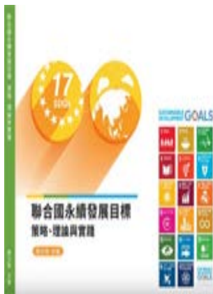
聯合國永續發展目標：永續產業 理念與實踐